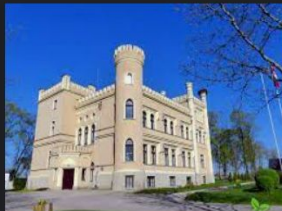
Gārsenes muiža celotajs.lv