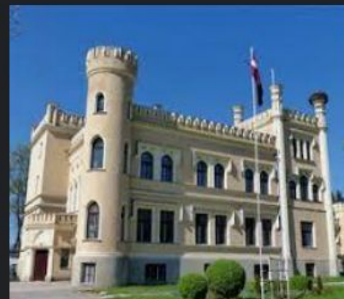
Gārsenes pils, pils : Labieši, Gārsene, ... viss.lv