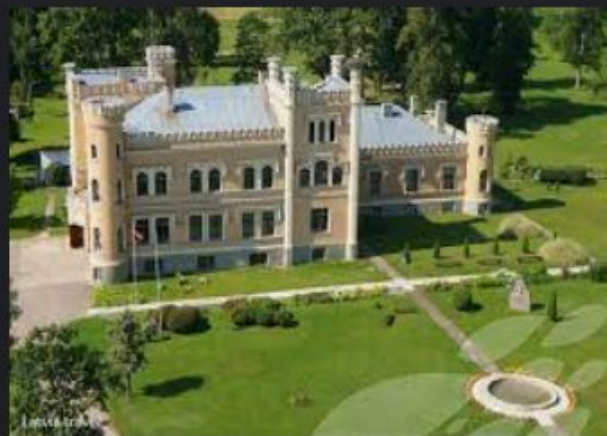
Gārsenes pils | Latvia Travel latvia.travel