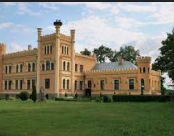
ene – Vikipēdija kipedia.org