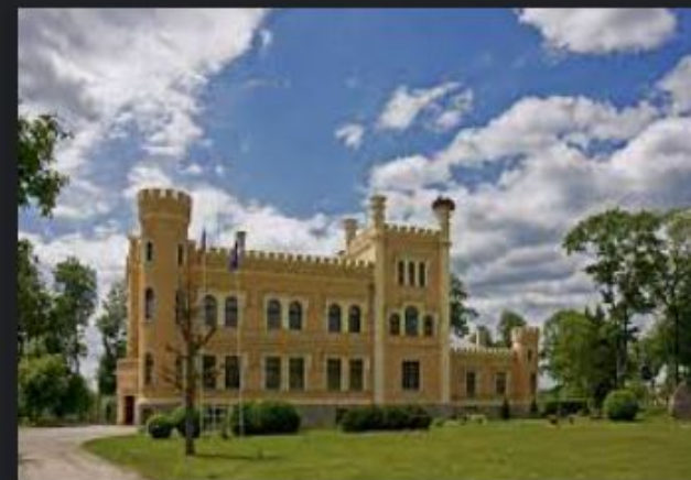
Gārsenes pils - redzet.eu redzet.eu