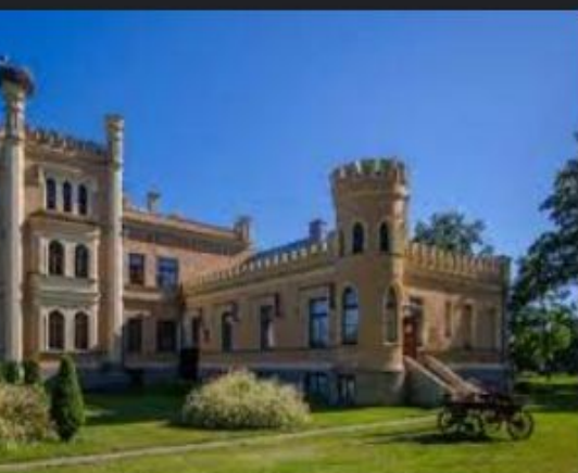
enes pils - Skolēnu ekskursijas nuekskursijas.lv