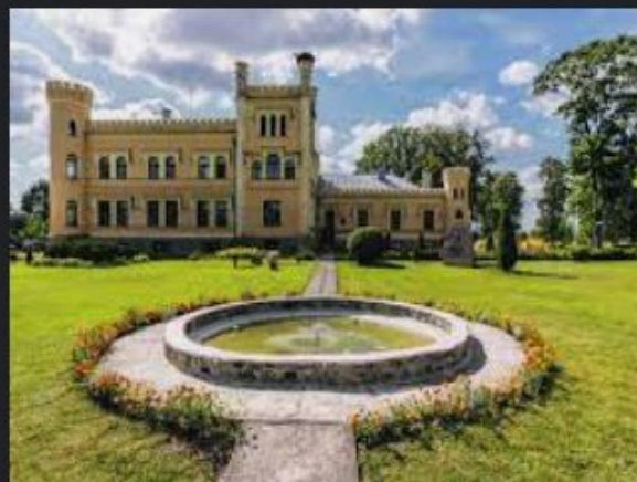
Gārsenes pils: vieta, kur satikties ar senatni... nra.lv