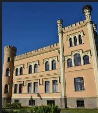
Gārsenes pils un dabas tak... facebook.com