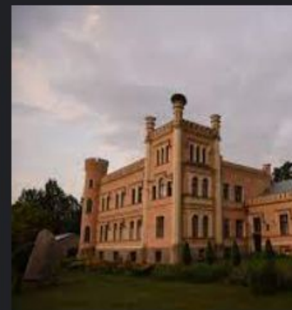
Gārsenes pils - Precos.lv precos.lv