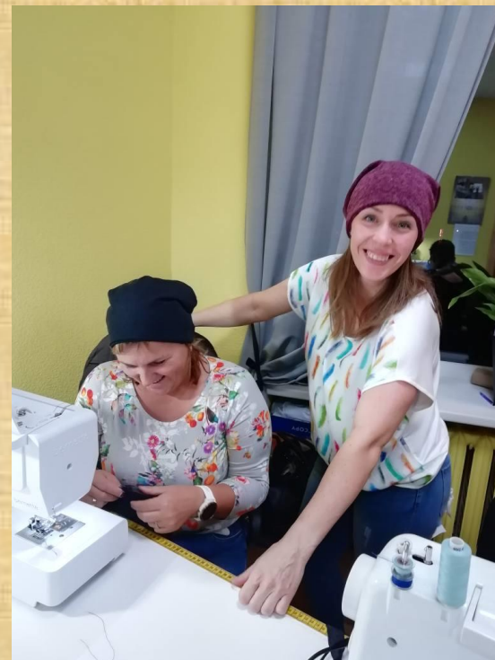
Trikotāžas cepurīšu un tuneļšalle šūšana