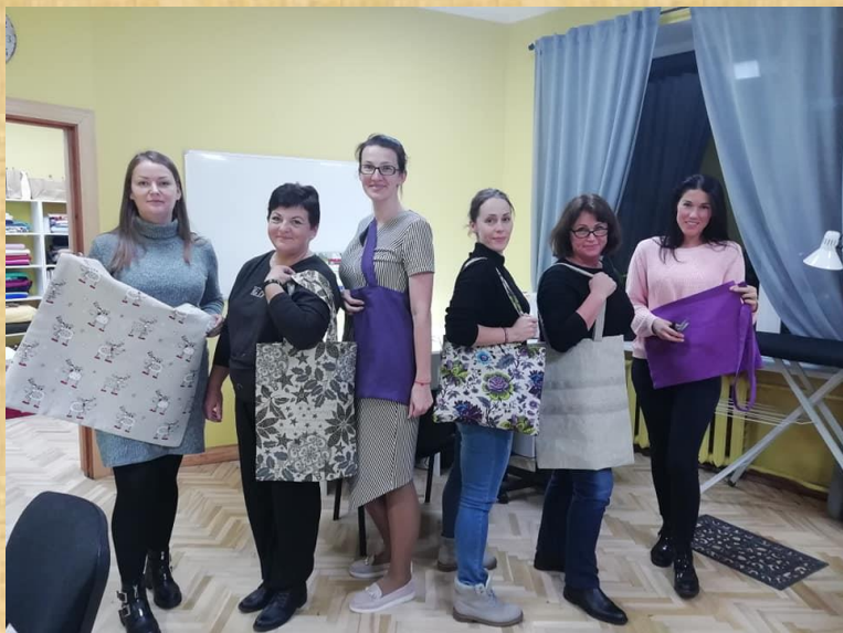
Iepirkuma somu šūšana