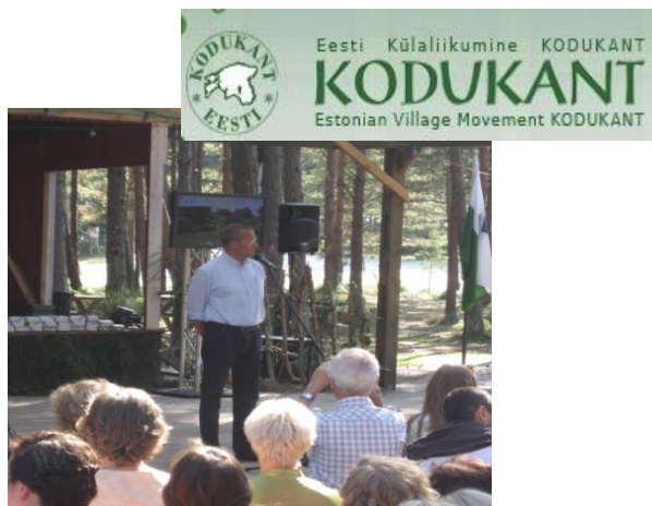
Igaunijā kopš 1996. gada

Izvirza prioritātes un izveido darba plānu līdz nākamajam pasākumam, uzņemoties kopīgu atbildību! Ļoti dažās formās, ar dažādām metodēm, ilgumu, dalībnieku skaitu un atmosfēru, bet ar kopīgu mērķi notiek vairāk kā 15 Eiropas (t. sk. Ārpus ES) valstīs