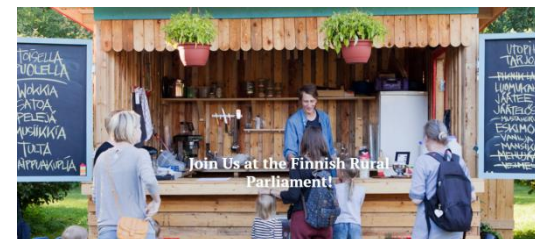
Somijā kopš 2017. gada