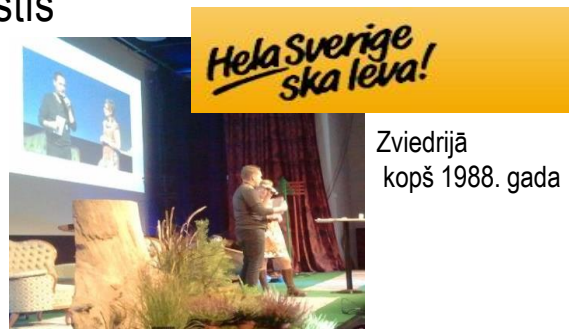
Zviedrijā kopš 1988. gada