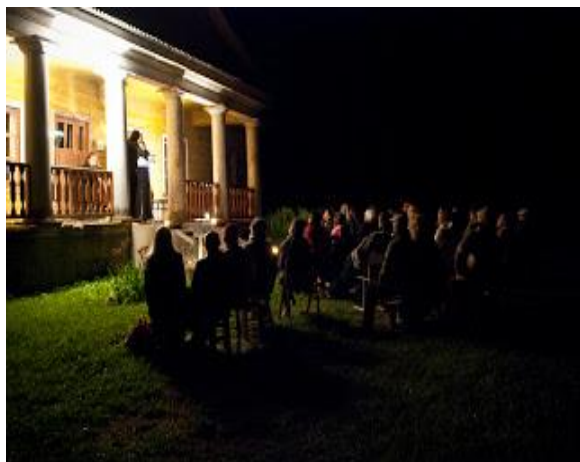
Zvaigžņotās nakts koncerts 2012.gada 11.augusta naktī